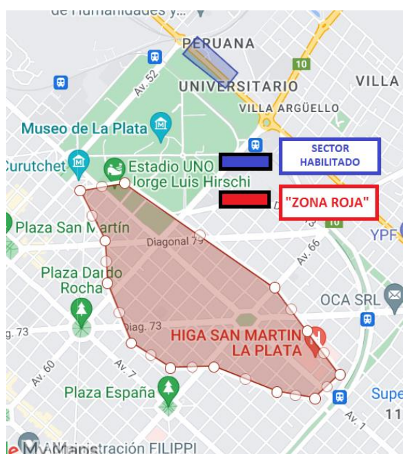
Mapa de la actual Zona Roja y el espacio propuesto para la relocalización.

La denominada Zona Roja de la ciudad de La Plata, ubicada históricamente en el barrio El Mondongo, se consolidó como un espacio donde mujeres, en gran parte travestis y trans y migrantes, viven y ejercen el trabajo sexual. En abril de 2023 la Municipalidad de La Plata anunció que se avanzaría con la reubicación de la Zona Roja hacia el sector comprendido sobre la avenida 122, entre 52 y 55, detrás del Paseo del Bosque, ubicado exactamente en el límite de los municipios de La Plata, Berisso y Ensenada.