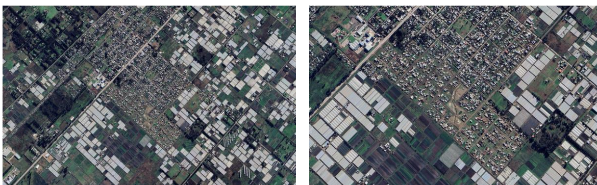
Figura 3. Barrio Abasto Nuevo. 2024

Actualmente tiene alrededor de 52 manzanas y 995 lotes, y se halla circundado por invernaderos destinados a la producción hortícola, lo que denota la gran incompatibilidad de usos tan presente en la periferia platense. El barrio tiene acceso irregular a la energía eléctrica y agua y los desechos cloacales son eliminados a través de pozo ciego.