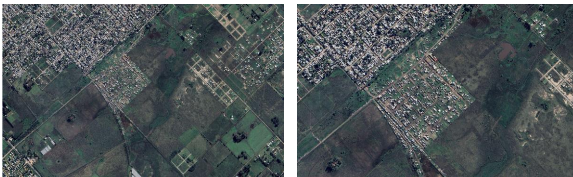
Figura 2. Barrio Puente de Fierro / Barrio Evita. 2024.

encuentra localizado dentro del área rural del Partido de La Plata (según la normativa de usos de suelo vigente, Ord. 10703), pero muy cercano al área urbana. En cuanto a los servicios básicos, tiene acceso irregular a la red de agua y eléctricas y los desechos cloacales se eliminan a través de pozo ciego.