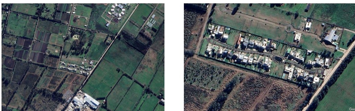
Figura 4. Barrio Las Huertas.

El barrio Las Huertas se localiza en el eje noroeste del Partido en la localidad de Joaquín Gorina, en la calle 501 entre 151 y 152. Tuvo su origen en el año 2015, donde comenzaron las tareas de apertura de calles y la primera vivienda se comenzó a construir en el año 2017. Posee 44 lotes para destino de vivienda unifamiliar, con medidas variables entre 450 a 600 m 2 . En la actualidad hay 3 parcelas vacantes, y solo posee los servicios de luz y agua. Según la normativa vigente en La Plata (Ord. 10.703), se localiza sobre área complementaria, como zona de reserva para ensanche urbano 1 , en donde la parcela mínima es de 10.000 m 2 . Por lo tanto es un barrio informal, ya que posee informalidad legal-normativa.