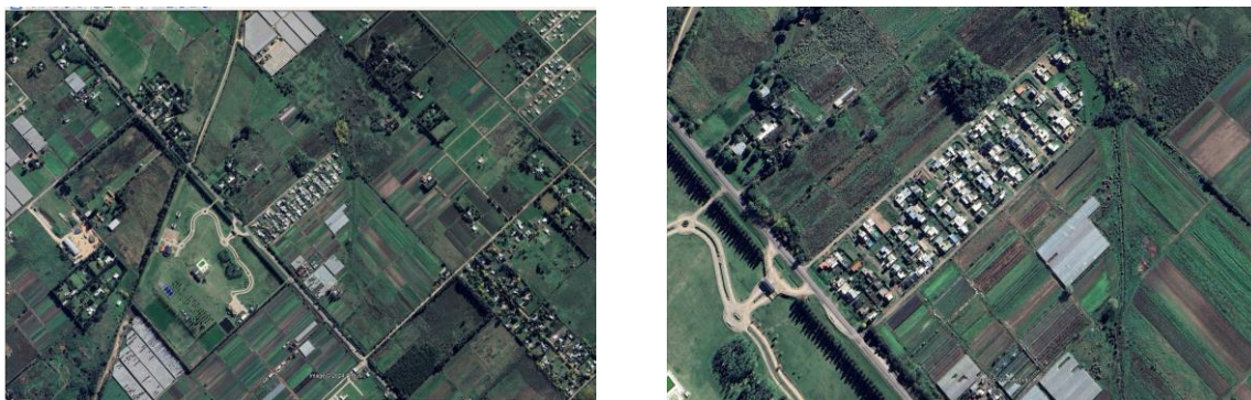
Figura 5. Barrio abierto. Fuente: Google Earth. 2024