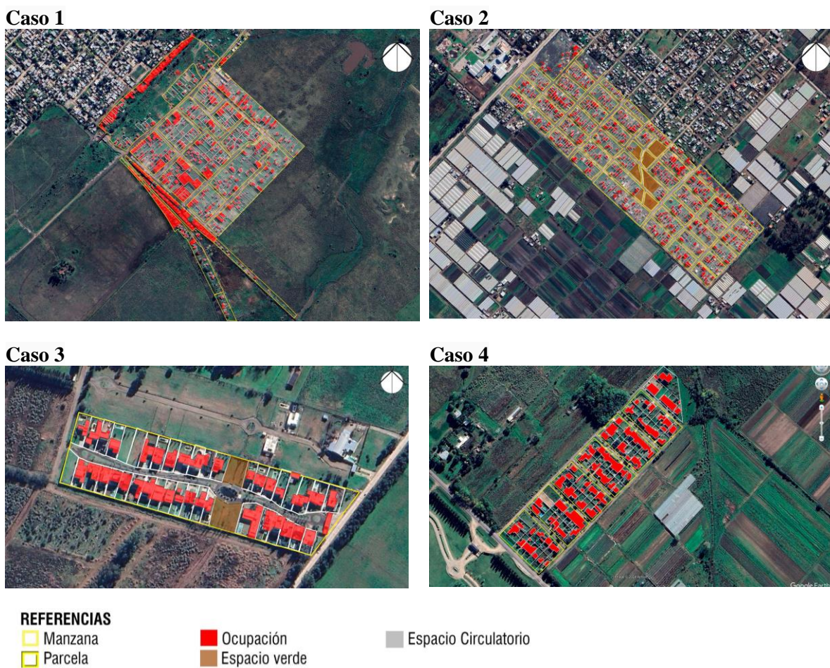
Figura 6. Análisis morfológico en los casos de estudio.