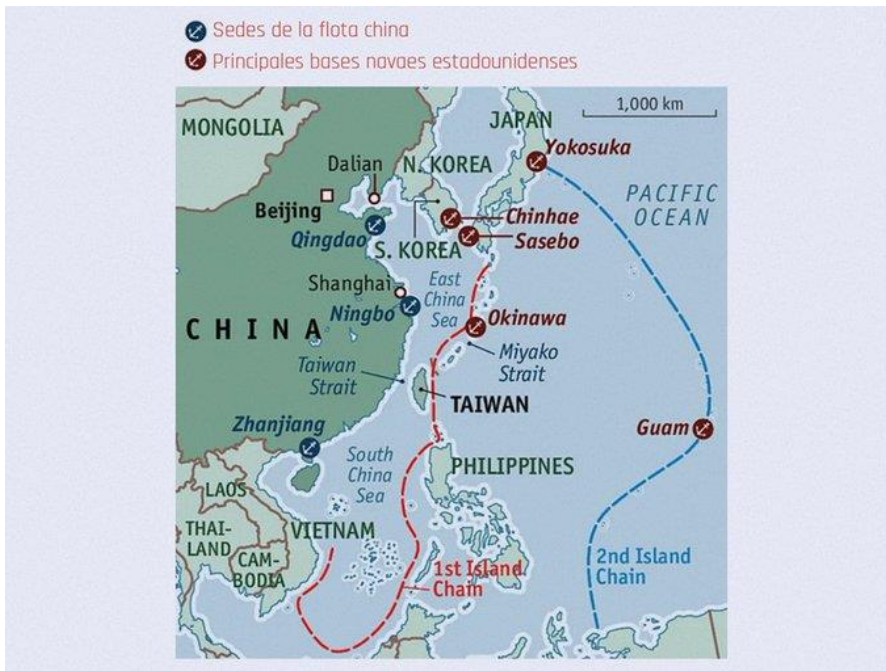
Imagen 3: Las dos cadenas de islas que rodean China.

(ii) El segundo es la importancia de Taiwán en la producción de semiconductores y microchips. En efecto, la empresa taiwanesa “Taiwan Semiconductor Manufacturing Company” (TSCM) produce el 24% de los microchips del mundo, según datos del año 2020. La disputa por la producción de microchips y semiconductores, en un escenario de crecientes tensiones y disrupción de las cadenas globales de valor, ha hecho que Washington busque reconfigurar su política de fabricación de estos componentes a partir de la Chips and Science Act, la cual autoriza al gobierno estadounidense a invertir 52 mil millones de dólares en la construcción de instalaciones para la producción de semiconductores y microchips en suelo estadounidense xxvi .