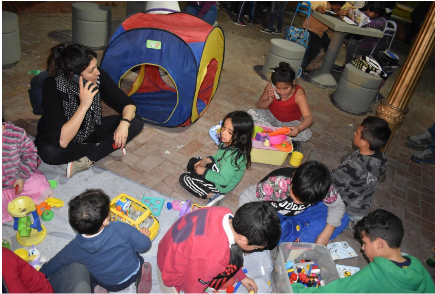
Fotografía 4. El Restaurant

6 de septiembre de 2018