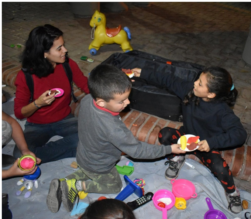
6 de septiembre de 2018