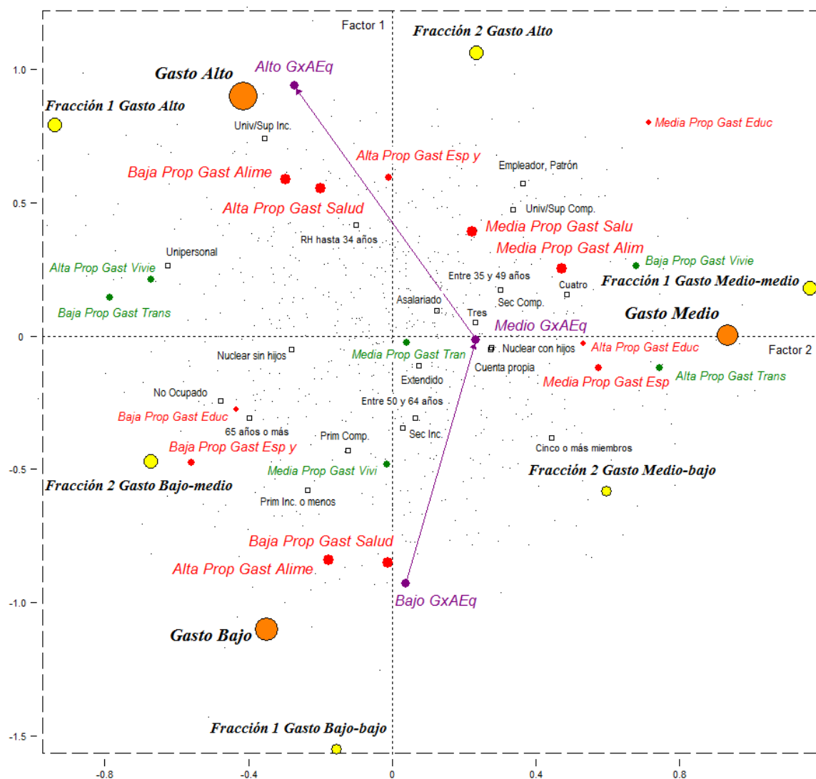
Diagrama 1.1: La estructura del gasto de los hogares cordobeses. 1° y 2° factor (79,3% de inercia)

Todo parece indicar que este primer factor se ordena conforme el volumen del gasto total y así decidimos mostrarlo en el diagrama a través de la línea que une las categorías de esa variable. Expresando el 63,3% de la inercia total (siempre a partir de la corrección de los valores propios), se encuentra conformado principalmente por las contribuciones de las variables que remiten al Gasto total (26,9), al gasto en Atención Médica del RH (18,8) y el gasto en Alimentos y Bebidas (17,1). También contribuyen, pero en menor medida, los