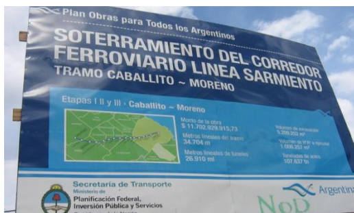
IMAGEN 4: Anuncio sobre la realización del Soterramiento de la Línea Sarmiento, a través del proyecto conocido como Corredor Verde del Oeste, en estación de San Antonio de Padua (Secretaría de Transporte, Ministerio de Planificación Federal, Inversión Pública y Servicios. Presidencia de la Nación).

país de la gigantesca tuneladora alemana (TBM, por tunnel boring machine ) con la que comenzarían las obras del ambicioso y demorado soterramiento (ver Imagen 4 ).