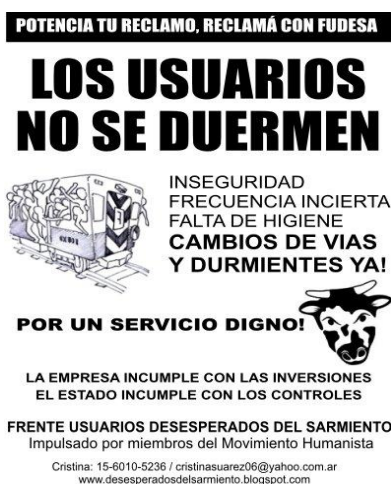
IMAGEN 3: Volante de FUDESA (Frente Usuarios Desesperados del Sarmiento). Las demandas de los usuarios se radicalizaron desde 2011, cuando dos grandes eventos –una “furia” de viajeros en Mayo: un choque con 11 muertos y 265 heridos, en Septiembre- legaron nueva y renovada visibilidad pública y mediática a la problemática.

A principios de Mayo de 2011, una nueva “furia” de usuarios tiene como consecuencia grandes destrozos en la estaciones de Haedo –histórico epicentro de esta tipología de eventos-, Ramos Mejía y Ciudadela. Retroalimenta las demoras y el mal funcionamiento general del sistema 7 , y es acompañada por la radicalización y el crecimiento en la organización de las demandas (ver Imagen 3 ). Tras esta nueva oleada de “furias”, surgen nuevas y/o renovadas versiones sobre las características de su génesis (desde la difundida académicamente, ya mencionada, de los “ trenes en llamas por disconformidad de usuarios ” hasta otras que inducen un daño auto-infligido por parte de TBA para justificar nuevas inversiones gubernamentales). La complejidad del tema amerita, creemos, nuevas y exhaustivas investigaciones.