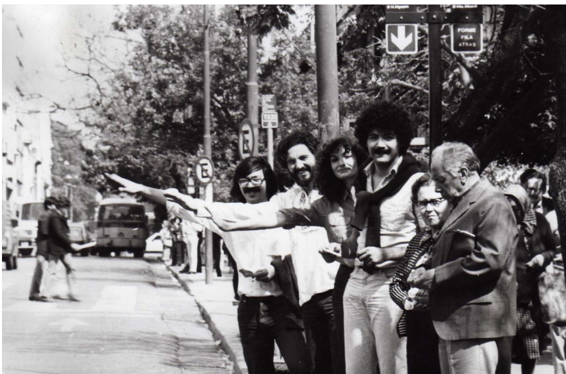
Fig. 2: fotografía integrantes de “Córdoba va” (Plaza San Martín, sobre la calle 27 de abril)