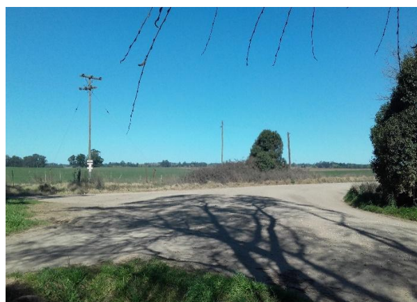
Fotos: Paraje El Coyunco 7 , 2016.